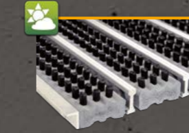
Brushline 005k Bürste aus PPN und zusätzlich montierter Alukratzkante