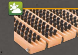
Brushline Holz Naturprodukt aus unbehandeltem Buchenholz ST1 ca. 60 x 40 cm