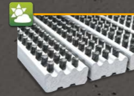
Brushline 003 Nylonbürste

Brushlinematten sind ideal für den Außenbereich. Die groben Bürsten eignen sich bestens bei hohen Schmutz- oder Schneeaufkommen. Die Kratzkante verstärkt die Abstreifwirkung und erhöht die Stabilität. Wir empfehlen den Einsatz ab 80 cm Stablänge. Die Kunststoffträger sind bestückt mit PPN Bürsten (Typen 005/005k) oder mit Nylon 6.6 (Typen 003 oder 003k). Letztere sind UV-beständiger und wesentlich abriebfester.