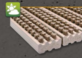
Brushline 005 Bürste aus PPN