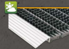
Brushline on TOP Bürstenmatte mit Alurampe ST1 60 x 40 cm, ST2 ca. 75 x 50 cm