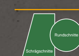
Sonderformen Siehe dazu Seite 27