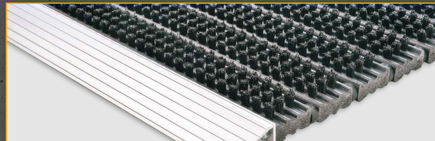
Rutsch- und stolpersichere Standardmatte mit Anlaufschiene zur aufliegenden Verlegung ohne Montage. Preis und Leistung aus Überzeugung!!!