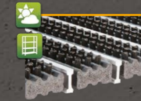
Brushline 003k Nylonbürste mit zusätzlich montierter Alukratzkante