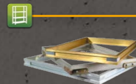
Winkelrahmen Die passenden Rahmen finden Sie auf Seite 24